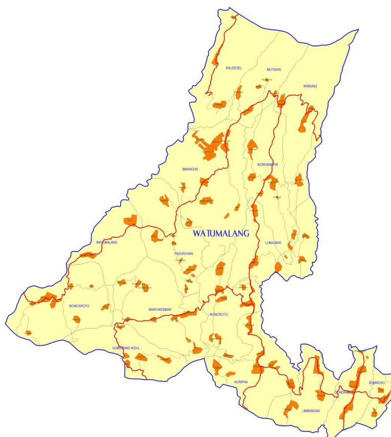
Peta Kecamatan Watumalang